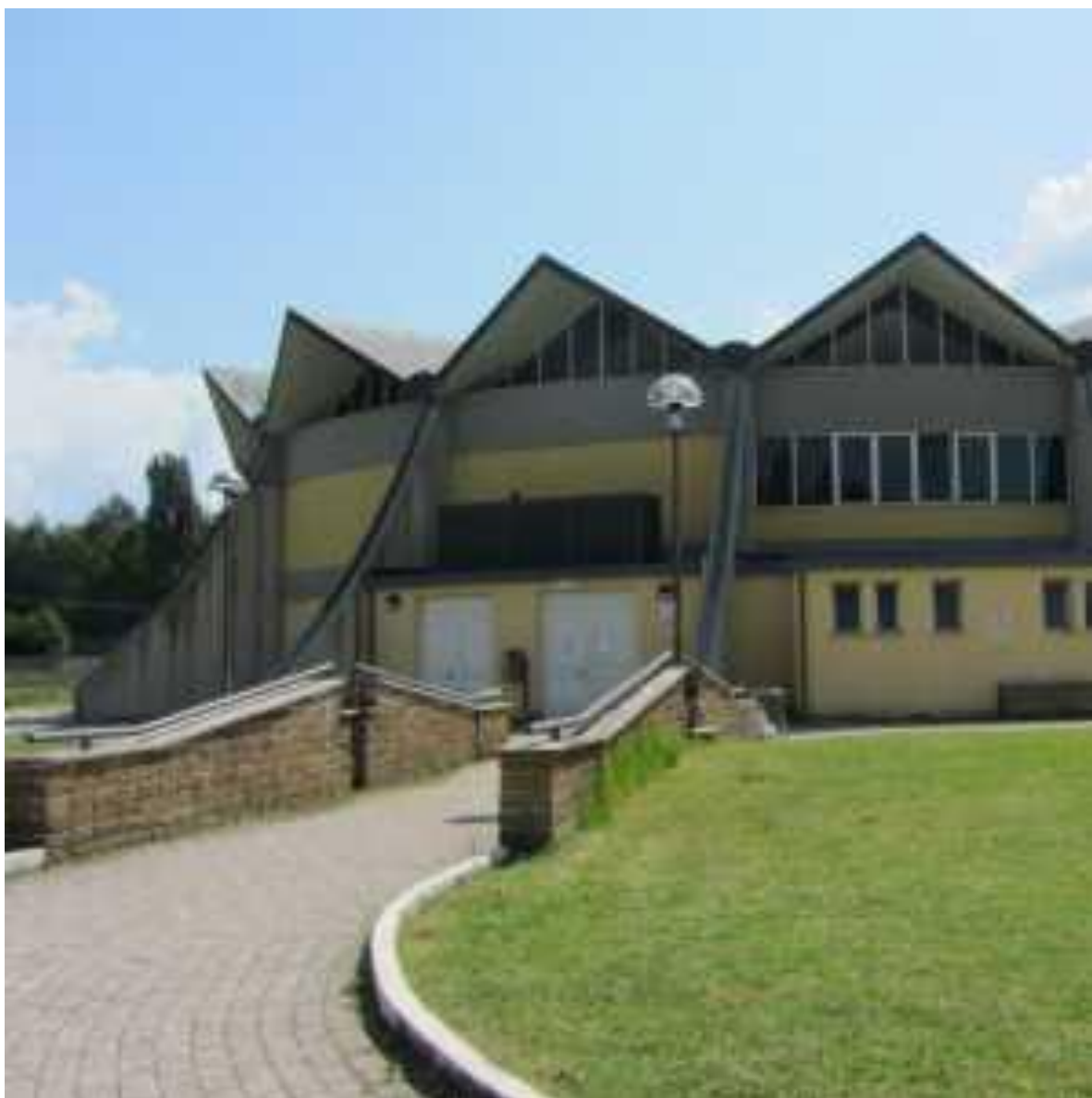
PALAZZETTO DELLO SPORT DI ATINA (FR) Via DELLA CARTIERA SNC